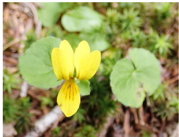
キバナノコマノツメ (葉が馬の蹄の形)