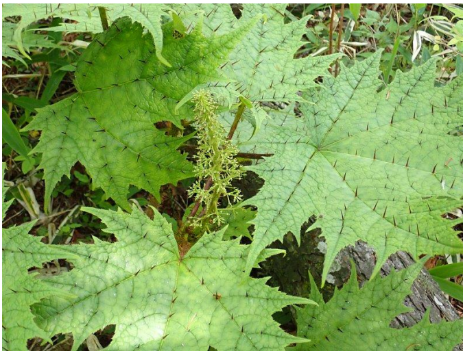
ハリブキ (花が咲いています)