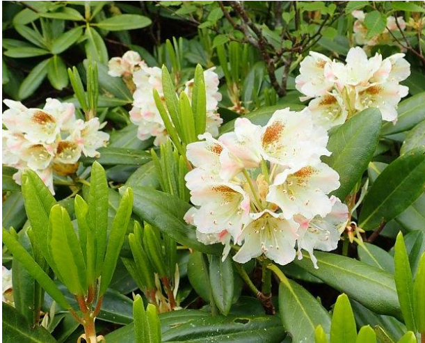
ハクサンシャクナゲ