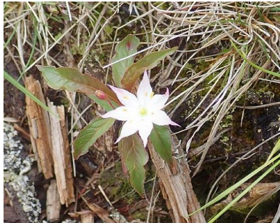
ツマトリソウ (襦取草・端取草)