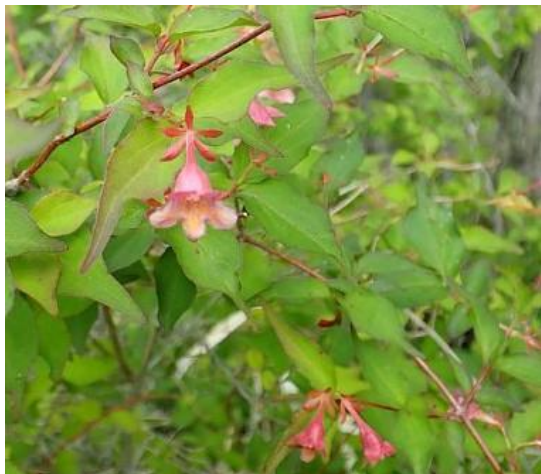
ベニバナツクバネウツギ