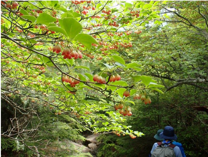
サラサドウダンツツジ (更紗満天星躑躅)